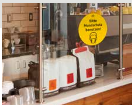
In der Gastronomie